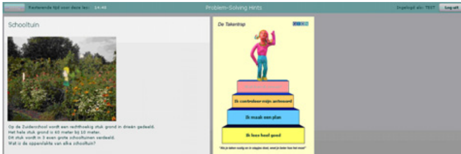
Figuur 3.2: Beginscherm met opgave en Takentrap (gelijk voor audio- en tekstversie)

In de controleconditie is er geen Takentrap en kunnen de leerlingen geen hulp krijgen. Wel wordt aangegeven of een opgave goed of fout is beantwoord en zijn er ook daar drie antwoordpogingen toegestaan.