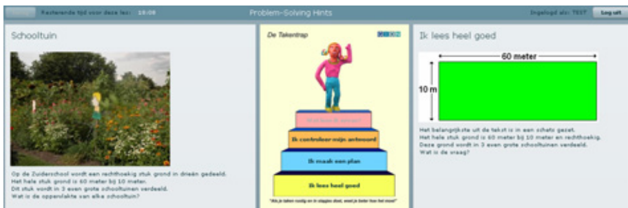
Figuur 3.3 Screenshot van hint 'ik lees heel goed' in de tekstconditie

De tijd is voor de leerlingen zichtbaar gemaakt in een blauwe balk die kleiner wordt naarmate het aantal seconden vordert. Zodra de balk weg is, is de hint niet meer zichtbaar. De duur is gebaseerd op inspreektijd van de hint. In figuur 3.3 is de illustratie met tekst bij de hint 'ik lees heel goed' weergegeven. Het gaat om de tekstversie.