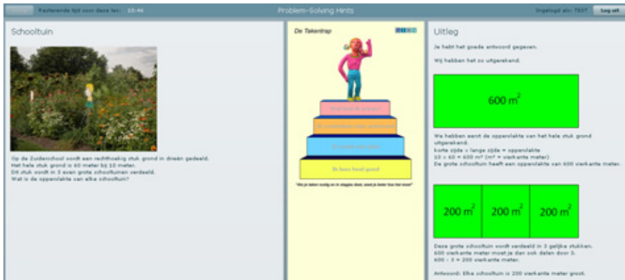
Figuur 3.5 Uitleg van de opgave bij de episode 'wat leer ik ervan?' in tekstconditie

Nadat leerlingen de uitleg hebben gelezen of beluisterd gaan ze door naar een laatste vraag die gaat over hun oplossingsproces. De vraag verschilt niet tussen beide experimentele condities maar verschilt wel tussen leerlingen die het juiste antwoord hebben gegeven en leerlingen die het antwoord fout hebben ingevuld. Bij de meerkeuzevraag over de opgave waar een goed antwoord is ingevuld wordt reflectie gevraagd over welke episodes volgens de deelnemer goed zijn gegaan. Bij het niet correct kunnen oplossen van de opgave gaat de vraag er om leerlingen te laten reflecteren over welke episodes niet goed zijn gegaan.